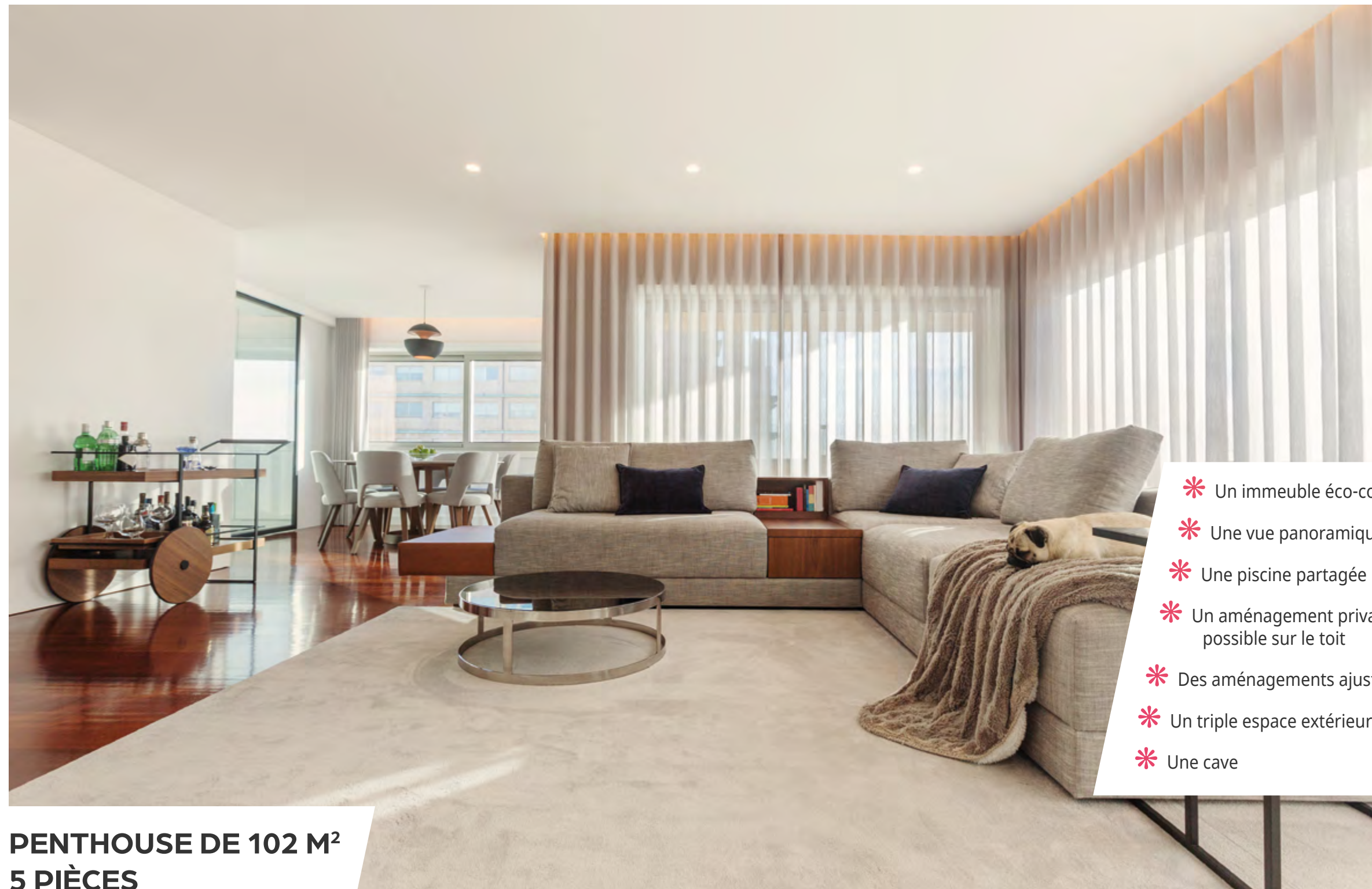
PENTHOUSE DE 102 M 2 5 PIÈCES