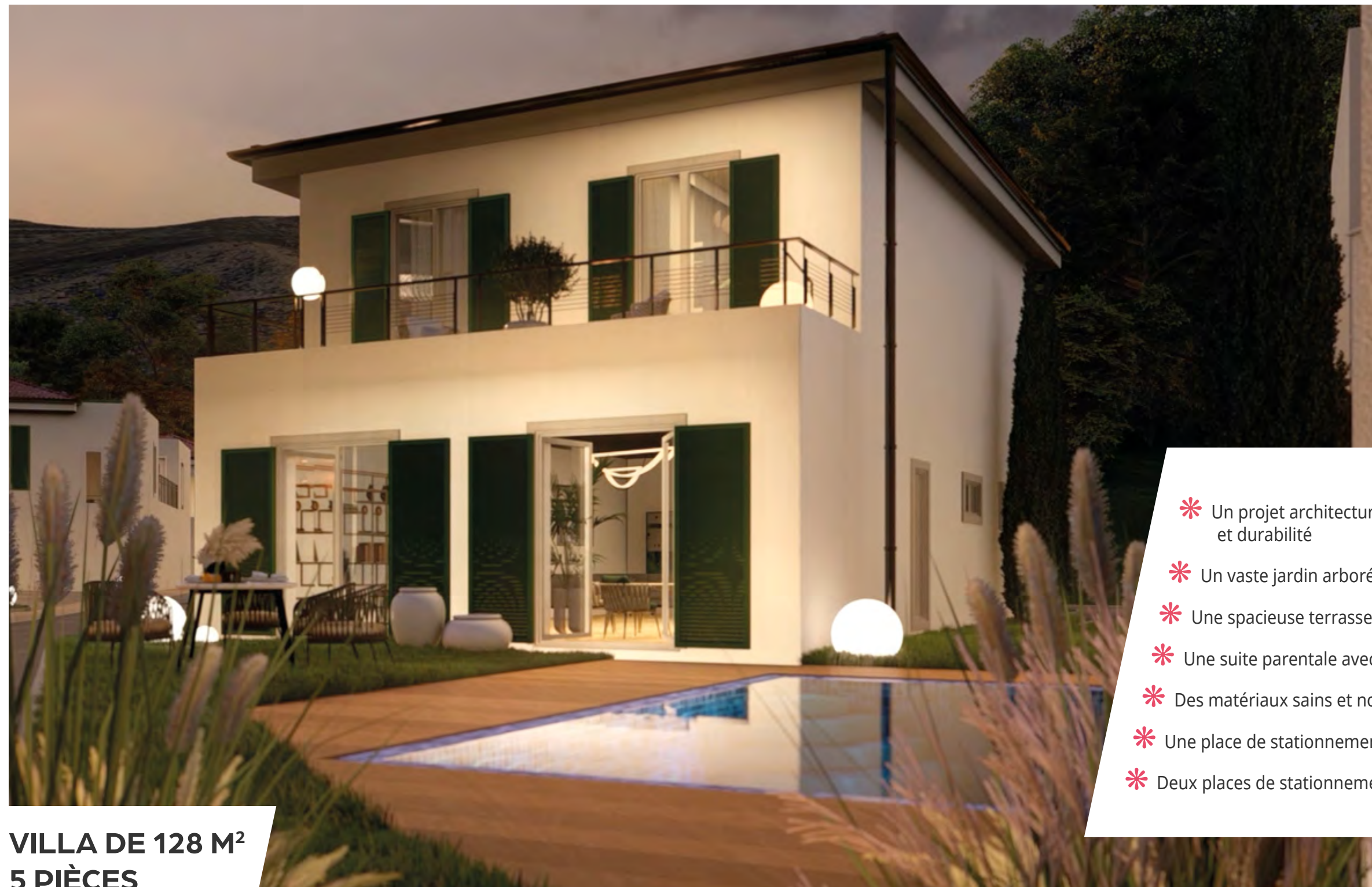
VILLA DE 128 M 2 5 PIÈCES