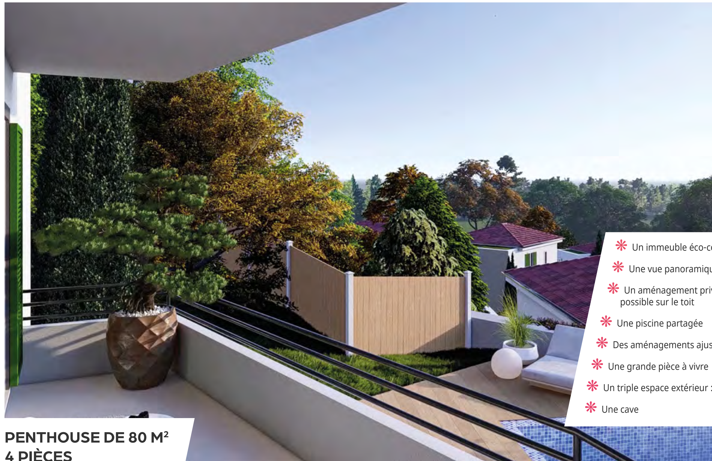
PENTHOUSE DE 80 M 2 4 PIÈCES